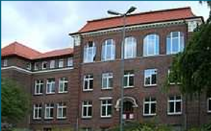
Kinder- und Jugendnotdienst Feuerbergstraße ind Hamburg