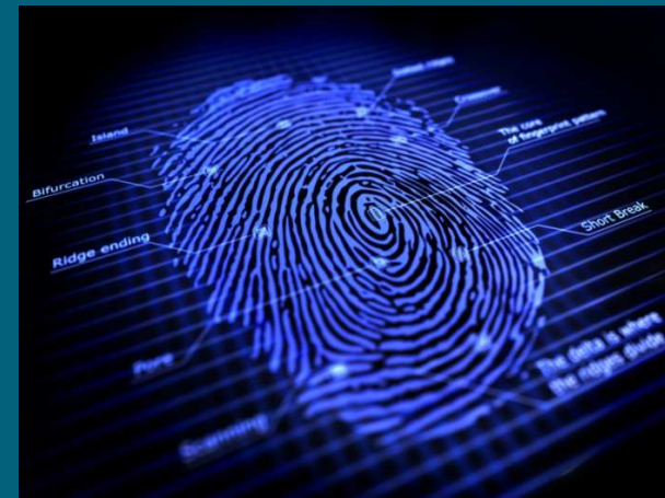
EURODAC, Europäische Datenbank zur Speicherung von Fingerabdrücken